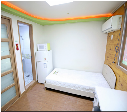
ワンルームタイプ寮 (1人1室)