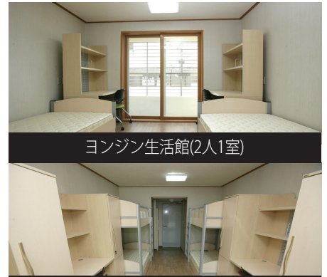
ヨンジン生活館(2人1室)