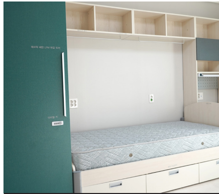
グローバル生活館A棟(2人1室)