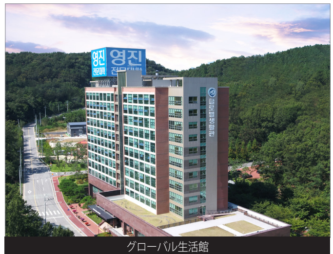
グローバル生活館